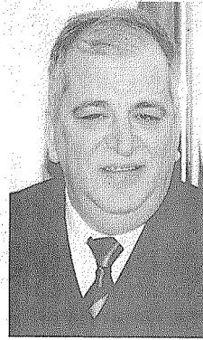
Muğla Ticaret Odası Başkanı Hayati Nizamoglu